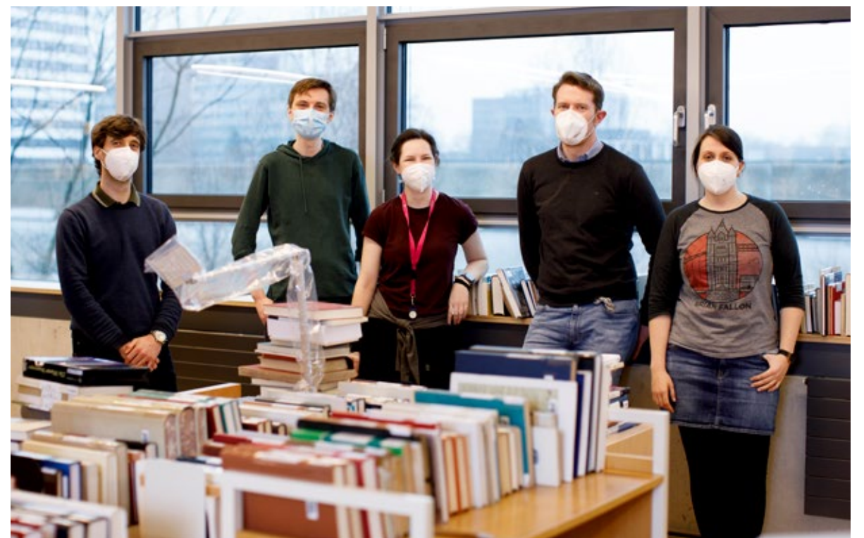
Umzug mit Maske: Die Mitarbeiterinnen und Mitarbeiter der Hochschulbibliothek