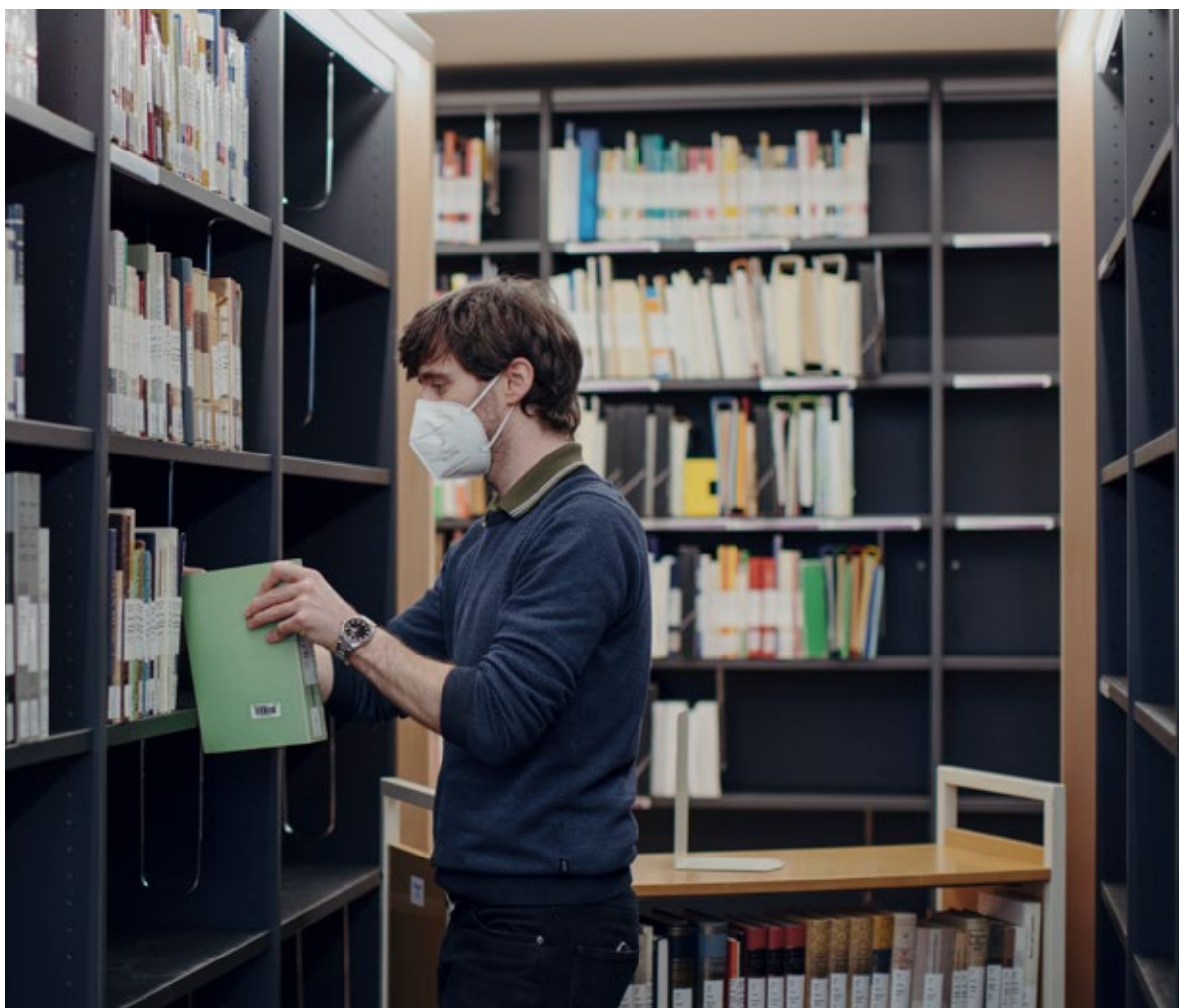
Kurz mal nachgeschaut: In der neuen Bibliothek ist der Großteil der Bücher frei zugänglich.